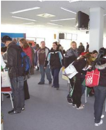
Ausbildungsbörse 2008 in der Arbeitsagentur Leipzig

Über 50 Unternehmen haben schon ihre Beteiligung zugesagt. Seien auch Sie dabei. Stellen Sie Ihr Unternehmen den Ausbildung Suchenden vor und sichern Sie sich so Ihre Azubis von morgen. Gerne nimmt Beatrice Adolph vom Arbeitgeberservice bis zum 31. Juli 2009 unter der Telefonnummer 0341 / 913 10264 Ihre Anmeldung entgegen.